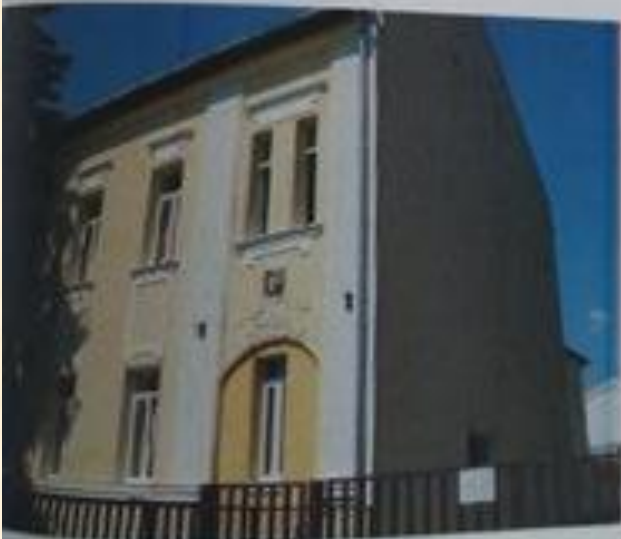
Nemzetőr Általános Iskola