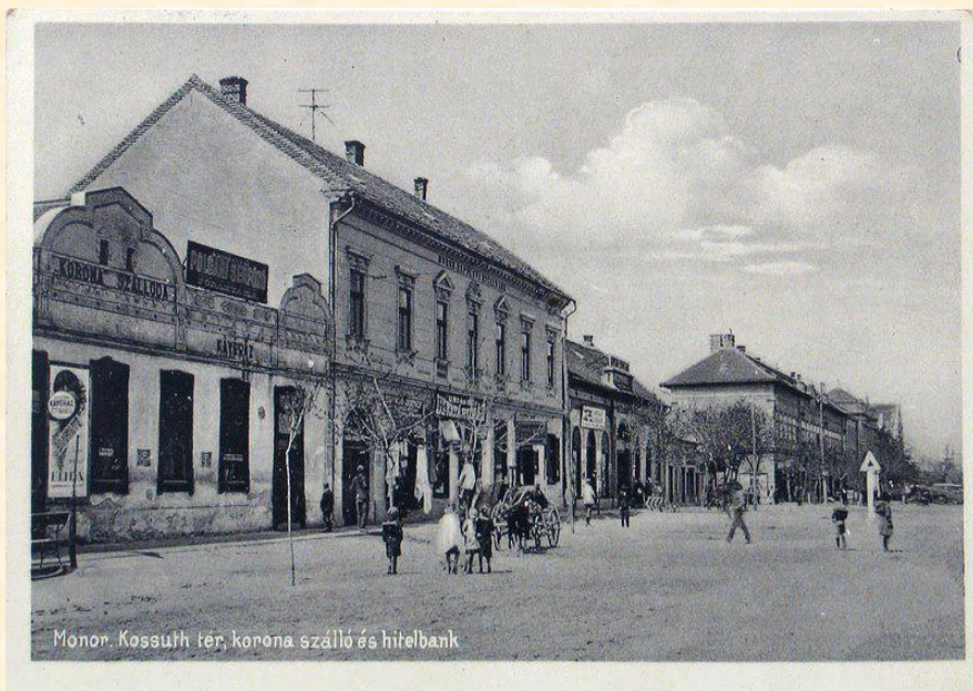
Monor, Kossuth tér, korona szálló és hitelbank