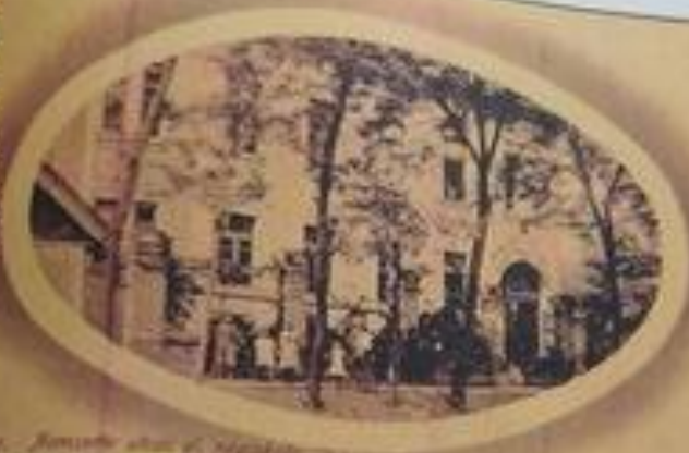
Nemzetőr általános iskolája